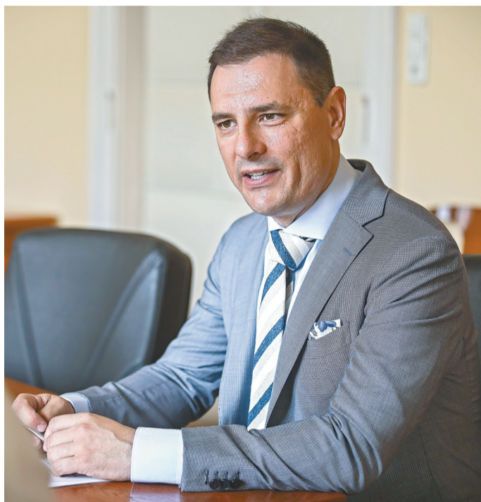
„Állja a sarat a közigazgatás a családvédelmi akciótervénél!”

→ Okostelefonon is lehet majd személyit intézni, az ingatlan-nyilvántartás is egyszerűbb lesz – vetítette előre lapunknak Tuzson Bence államtitkár