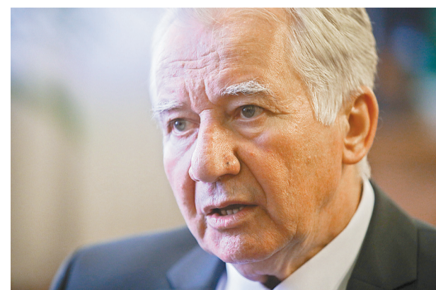
„Magyarországon nincs gond a jogállamisági keretekkel”