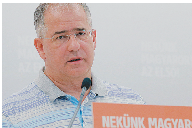
„A Fidesz több jelöltet állít októberben, mint 2014-ben”

→ Az őszi választásokon a kormány- pártok az építkezést, a fejlesztést és a gyarapodást kínálják a választó- polgároknak → Belföld 3. oldal