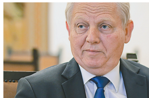
„Annyi akadályt leküzdöttem már életem során. Bizom benne, hogy a feladattal most is meg fogok birkózni”

→ Karácsony politikai szerencselovag, tele van botrányos ügyekkel, és alig tud többet a város működéséről, mint Puzsér Róbert