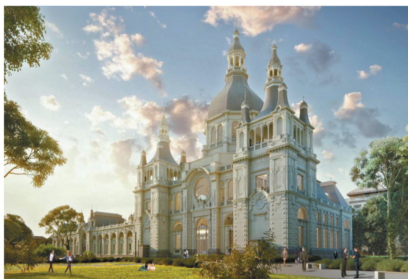
A Liget-projekt a nyugati világ legnagyobb kulturális fejlesztése

→ A főváros idén az iparüzési adóból annyit szed be, mint a járvány előtt