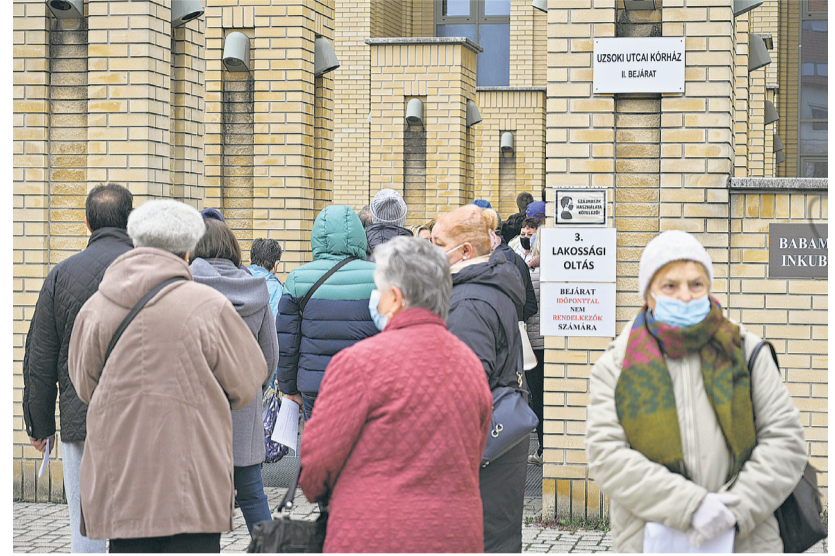
Uzsoki úti kórház – teljes a nagyüzem